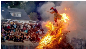
Sankthansfesten 2018 i Odsherred

I Danmark fejrer vi Sankthansfesten. Det er en dag hvor vi fejrer fødslen af St. John Eve. Vi fejrer det d. 23. juni. Mange lande fejrer den ved at tænde et stort bål men i Danmark brænder vi en heks på bålet. Heksen brændes for at holde de onde ånder væk.